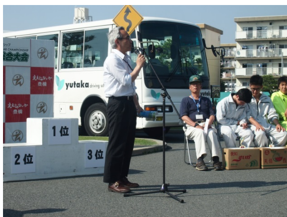
■角田センター長のご講評