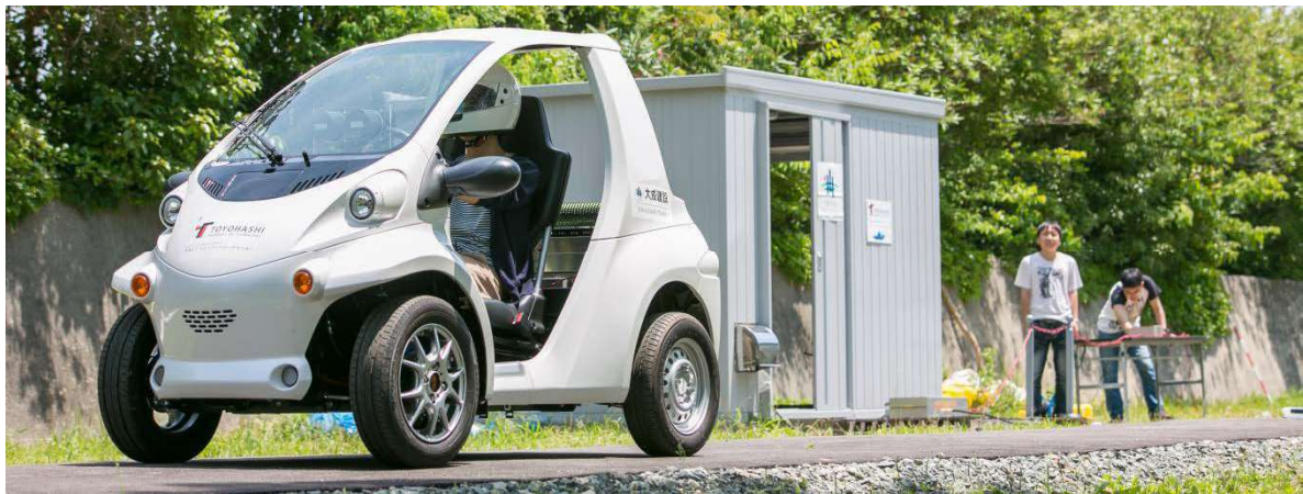
図1-2-1 ワイヤレス給電技術でバッテリーレス小型電気自動車の連続走行に成功

タイヤ集電技術によるEVへの連続走行中給電の実現可能性を示す。本年度は時速10kmで走行中のバッテリーレス小型EVへ5kWのワイヤレス電力伝送に成功した。試作したワイヤレス電力伝送システム試作は、電化道路、タイヤ集電機構、RF整流回路、レギュレータの4種類の機器からなり、全てハンドメイドである。電化道路は一般的なアスファルト舗装道路を基とし、2つの金属板をアスファルト下に敷設した。試作したシステムを用いてEVの走行実験を実施した。結果、電化道路からの電力のみで、バッテリーレスEVの連続走行を達成した(図1-2-1)。