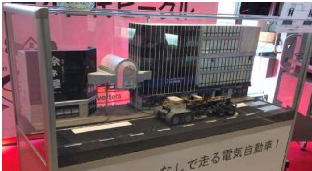
図 1-3-1 走行中 EV へのワイヤレス電力伝送システムのジオラマ

上記3つの成果により電気自動車へのワイヤレス電力伝送の実現可能性を世の中に強く示すことに成功した。今後は本学が提唱するワイヤレス給電技術の社会実装に向けた取組みに着手する。