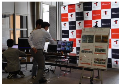
■2色覚の方に色を見やすくするための画像処理 (金澤研究室)