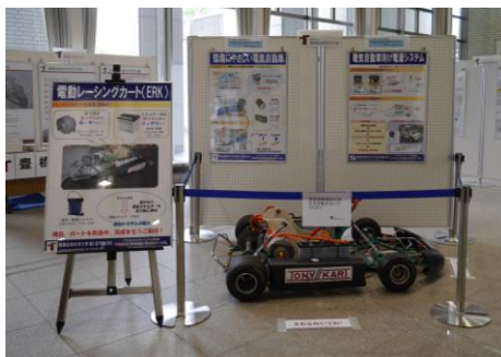
■電動化レーシングカート (滝川研究室)