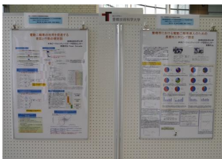
■研究紹介ポスター (後藤研究室)