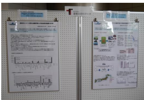
■研究紹介ポスター (宮田研究室・渋澤研究室)