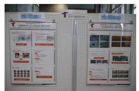
■研究紹介ポスター (金澤研究室)