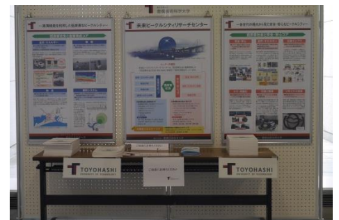
■センター紹介ポスター