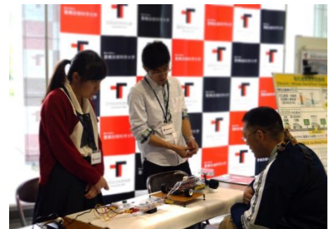
■電化道路電気自動車 EVER (大平研究室)