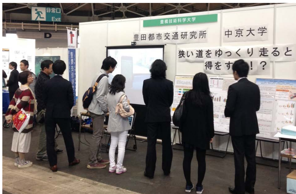
松尾研究室 展示の様子