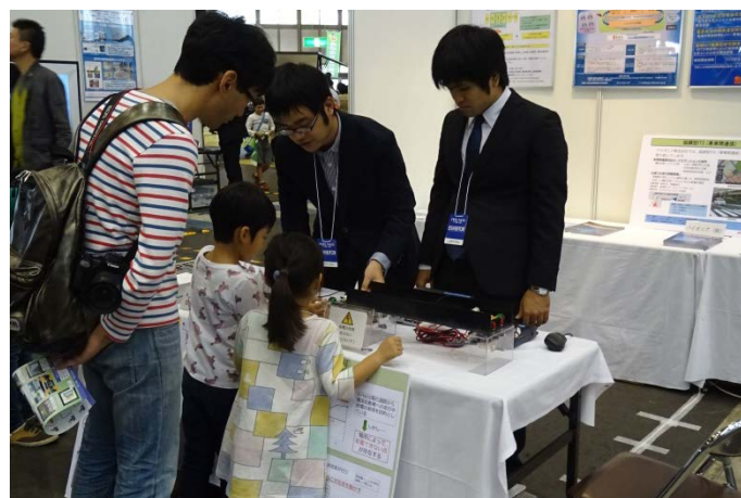
大平研究室 展示の様子