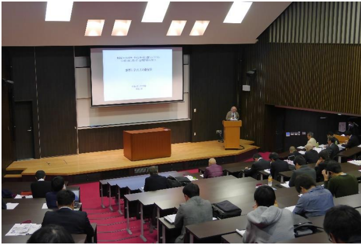
【特別ゲストスピーチ】の様子